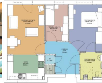
Enghraifft o fflat dwy loft